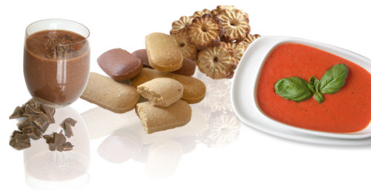
“ALIMENTI DA EVITARE ”