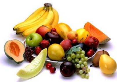
“ALIMENTI DA PREFERIRE ”

Le festività natalizie, pur tentando di essere attenti, ci lasciano con uno stato di gonfiore, e, se siamo fortunati, con un aumento di peso di almeno 2-3 chili. I pasti natalizi, si sa, sono un concentrato di delizie culinarie ed il frutto di ricette ipercondite. Se durante tale periodo si sono assorbite più di tremila calorie giorno, sarà opportuno, nei giorni a seguire, regolamentare al meglio la propria alimentazione seguendo semplici indicazioni e suggerimenti.